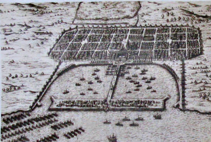
35. Alessandro d'Egitto, in Cristiano Ordo Imperatoris di Georg Beza e Franz Hogenberg, Colonia 1574