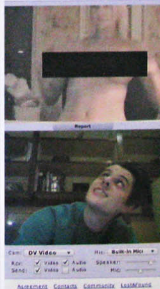
Immagini dalle chat roulette.

AS CI SONO MOMENTI DEL POTERE CHE SONO IN REALTÀ "CAMBI DI POTERE" CHE INFLUISCONO SUL TERRITORIO, SULLA REALTÀ, TRASFORMANDOLA. INFRASTRUTTURE, REALTÀ INDUSTRIALI DI UN CERTO TIPO, VENGONO TRASFORMATE E UTILIZZATE SIA PER NUOVE FUNZIONI LEGATE A NUOVE NECESSITÀ, SIA PER LA RAPPRESENTAZIONE DI ALTRI POTERI. PENSO ALL'UTILIZZO CHE SI FA CON L'ARTE, DEGLI SPAZI INDUSTRIALI O ALL'UTILIZZO, SEMPRE DI QUESTI SPAZI, PER TRASFORMARLI IN UFFICI, TERZIARIO, RESIDENZA. NELLA TRASFORMAZIONE