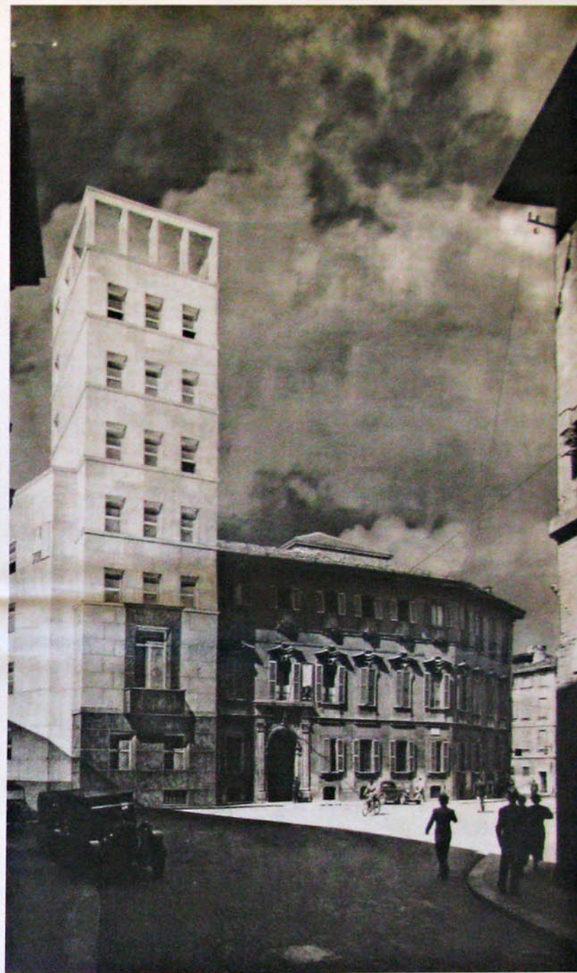
Casa del Fascio di Milano (piazza San Sepolcro), Arch. Pietro Portaluppi, assonometria dell'area e fotomontaggio. (Archivio Centrale dello stato) tratto da "L'Architettura delle Case del Fascio" Alinea Editrice, catalogo della mostra "Le case del Fascio in Italia e nelle terre d'Oltremare".

JS L'architettura oggi si trova di fronte a una nuova serie di sfide che hanno radici nella storia della modernità stessa. Il concetto del potere, che si traduce in mattoni o in pietre che si costruiscono e che diventano l'alfabeto del potere stesso, è sempre meno materiale. La vera facciata di ogni edificio si rivolge alla piazza pubblica dei nostri tempi che è la rete, la cui materialità è tutt'altra che quella del mattone. Quel modello che ha definito gran parte della modernità, dove gli stati-nazione hanno elaborato dei programmi di costruzione come nell'Italia mussoliniana, nell'Unione Sovietica di Stalin o persino il New Deal di Roosevelt negli Stati Uniti, si è andato nel tempo sempre più smaterializzando. Le reti di comunicazione stanno diventando la vera facciata del mondo costruito.