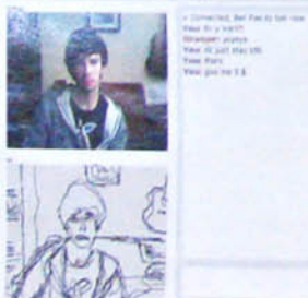
Immagini dalle chat roulette.

Casa del Fascio di Como (1932-36), arch. Giuseppe Terragni, (Quadrante, 27 ott. 1944, 35-36), tratta da "Architettura delle Case del Fascio" Alinea Editrice, catalogo della mostra "Le case del Fascio in Italia e nelle terre d'Oltremare".